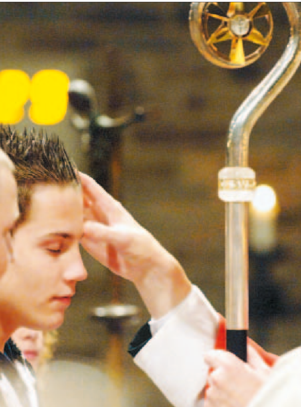
omt de tegenstelling tussen service- en elitekerk nog het meest tot uiting.